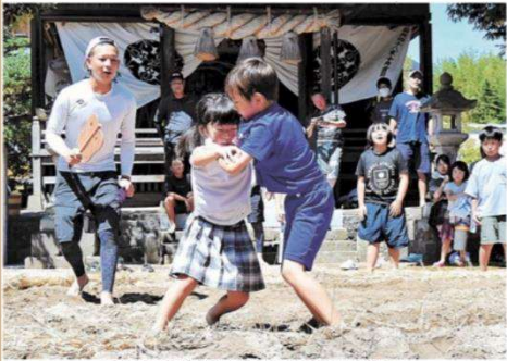
声援を受けながら相撲をとる子どもたち

北栄・松神神社で「七日日相撲」 北栄町松神の松神神社。ほか、昔にたつて青年団で、五穀豊穰と集落や家、男性の勝負気もあり、庭の幸せと安全を祈って、住民が声援を送った。100年以上続く奉納相撲。一か所で相撲を中止した「七日日相撲」が行われた。子どもたちは行司の「地区の子どもの取組の、発生したが、奉納相撲を再開。相手はぶつかったて後から押し出し、昇事に投げを決めたりするたびに壇内に歓声が響いた。青年団の迫力のある相撲には、地域の高齢者たちも盛大な拍手を送った。 参加した北栄小3年の牧田野歩さんは、勝ったり負けたりしむけ楽しめた」と満足そう。 浜根二三雄自治会長は「この相撲が地域の交流の場となつていて、子どもが喜ばれ命取り組んでくれたのでとても良い奉納となった」と話した。 (北栄通信部・本田広伸部長)