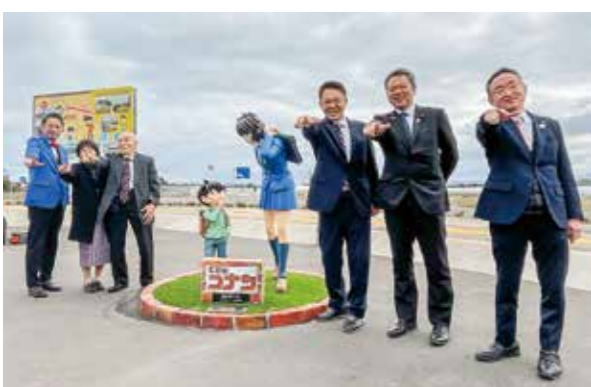
「名探偵コナン」のキャラクターが、また1つ北栄町に ©青山剛昌/小学館