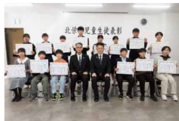
優れた活動を行った小・中学生を表彰