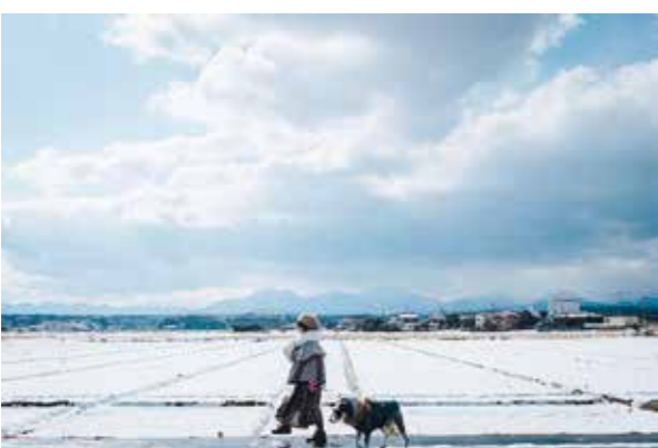
作品名「ちよっと散歩が絶景散歩」

町内の穂波地区で撮影されたこの一枚は、雪の散歩道が絶景に変わる、北栄町ならではの美しい風景を見事に切り取っています。町外からの新鮮な視点が光る素晴らしい結果となりました。