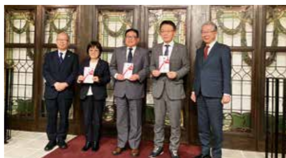
3市町の市長・町長へ寄付を手渡しし記念撮影

また、いよいよ家庭向けの電気の提供が開始されます。鳥取みらい電力の電気は二酸化炭素を出さない電気です。ぜひ、電気の切り替えをご検討ください。