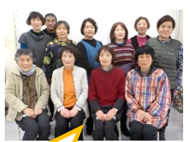
北条女性会のみなさん

北条・大栄女性会さんと連携し、新鮮でおいしい地元食材をふんだんに取り入れた「地産地消」給食を提供します。