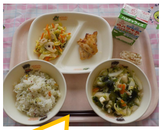
行事食献立(ひな祭り)