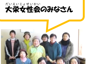
大栄女性会のみなさん