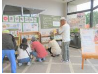
夢プロ ブックリサイクル