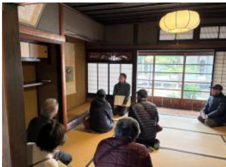
重要文化財 齋尾家住宅限定公開