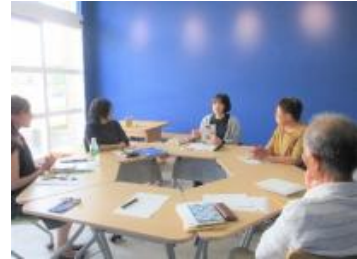
夢プロ ゆる〜い読書会

【成果】 町民主体の企画を取り入れることにより、地域の方との連携が密となり、図書館事業を官民の両輪で進めることができた。コンサート等のイベントを実施することで図書館に普段来られない方も足を運んでいただき、利用者の増加につなげることができた。