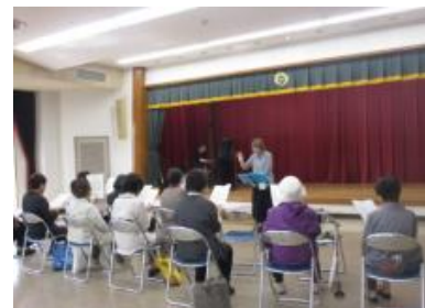
シニアクラブコース別学習 歌唱