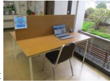
テレワークスペースと貸出用PC

【成果】 適切な点検、維持管理を行い、誰もが安心して気軽に集い学べる生涯学習の拠点施設として学びの場を提供し、仲間づくり、学びの推進ができた。 令和7年度はLED照明工事、修繕工事などを実施した。