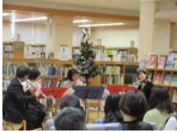
フルートコンサート

(町民主体)夢の図書館プロジェクト企画(ブックリサイクル・フリーペーパー・読書会 等) (図書館主催)春の図書館まつり(年1回)、図書館コンサート 等