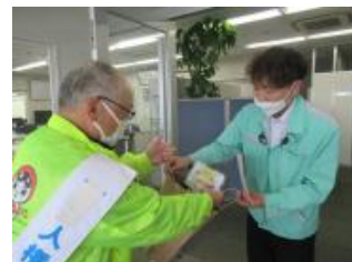
人権週間事業所訪問

【成果】 地域住民に対し人権思想の普及と人権相談による人権擁護に資することができた。