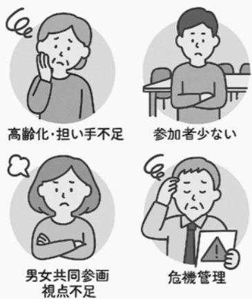
高齢化・担い手不足