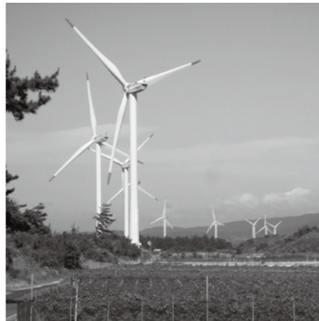
20年間町のシンボルだった風車どうなる...

今年1月に、風車による健康影響を研究する学識経験者を講師にオンラインで意見を交換。科学的かつ客観的な事実に基づく講義を受けた。さらに、この委員会は懸念される風車と自動車専用道路との間隔などに関し各分野の専門家に知見を求め議員の知識と理解を深めながら、令和8年度の当初予算を審議する3月定例会に向け活動している。