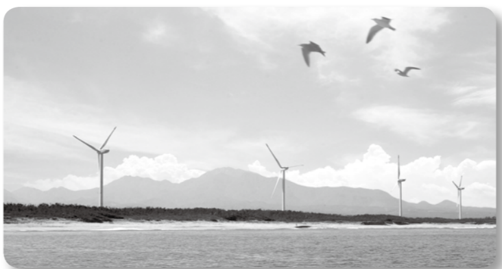
取り組みの拡がりに期待

町長 ① 10月末時点で、省エネ改修11件、創エネ設備設置17件。 ② 創エネ設備の設置、高効率空調・LED照明への更新等、相談や報告などを通じて状況把握に努めている。 今後も相談対応や制度情報の提供などを行っていく。