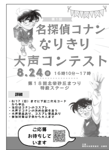
高校生が企画したチラシは、コレ!