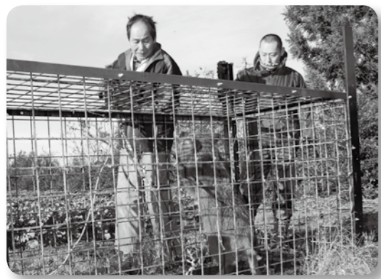
イノシシとったド

①イノシシは町内の丘陵地帯に生息していると認識する。9月までの被害状況は被害面積60㌥、被害額約100万円となっている。 ②令和6年度から「農作物を守る農業生産組織支援交付金」事業で取り組んでいる。引き続き研修会などで事業の普及を進める。 ③埋設場所の確保や埋設作業が捕獲者の負担となっているので、情報収集を