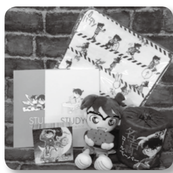
もっとコナンの返礼品を

町長 ① 総務省のルールに沿って検討したい。 ② 養蜂や長芋掘り体験は提供予定。他にもフルーツ狩り体験など拡充する。 ③ 意欲ある事業者さん同士をつなげ、アイデアを共有できる場の設定を進めていきたい。データは必要に応じて関係者と共有するなど活かしていきたい。