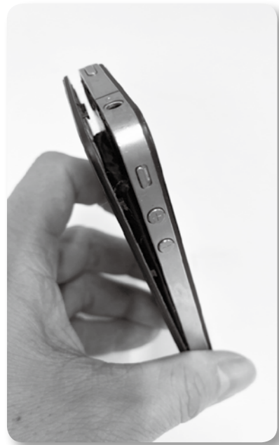
正しい取り扱いを

① 町内における事故は起きていない。使用中のリスクに対する周知は十分とは言えず、注意喚起の強化が必要。 ② 町の窓口へ直接持参いただきたい。耐火性のあるペール缶にて保管のうえ処分をしている。 ③ 広域連合で回収方法を協議中。詳細が決まり次第、周知を図っていく。