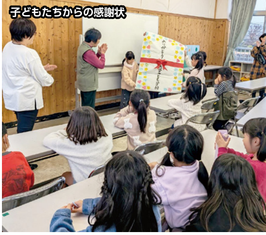
子どもたちからの感謝状