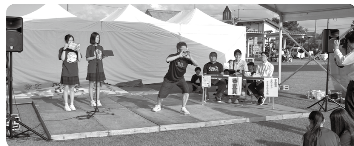
白熱の大声コンテスト、次はあなたも…