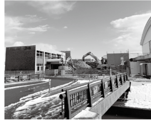
解体中の大栄分館

中央公民館大栄分館新築工事に伴い、キュービクルから直接体育館へ給電するための一時的に行う工事。本来の図書館を経由した給電系統に戻すための撤去費を、この仮設工事費と一緒に大栄分館本体建て替えの電気工事費に含めた方が安価と判断した。