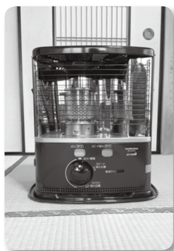
節約もそろそろ限界

町長 今年度、町では令和6年度から引き続いて住民税非課税世帯や子育て世帯、事業者へと、幅広く支援をしている。 今回、追加配分される重点支援地方交付金の活用では、示されている推奨事業メニューに沿った生活者の支援を考えている。 次年度以降も、国の交付金を活用した支援を行っていきたい。