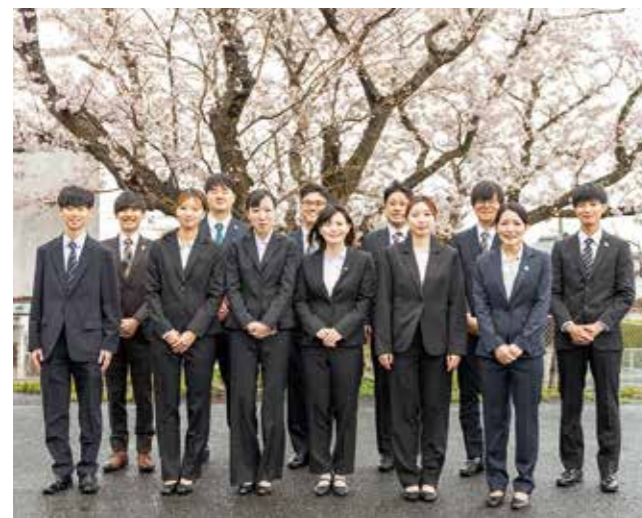
令和8年4月1日付で採用された皆さん