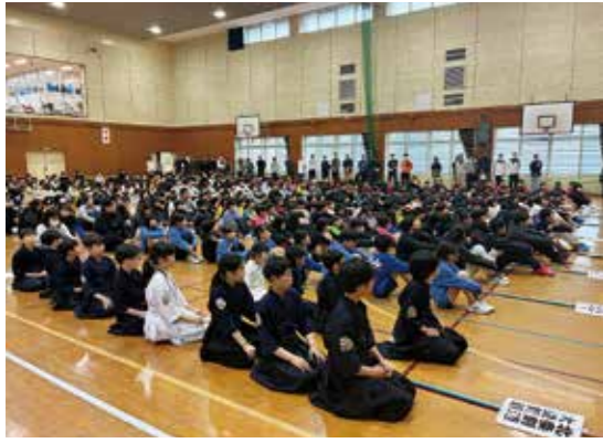
活動開始式の様子

4月4日、B&G海洋センターで令和8年度ジュニアスポーツクラブの活動開始式が開催されました。16団体、指導者67人と団員250人が新たな目標に向けてスタートを切りました。 ジュニアスポーツクラブは資格を持った指導者が専門性を持ち指導に当たっています。ジュニア期に運動の基礎を磨き、生涯にわたって運動を楽しむ習慣を身につけましょう。通年で入団を受け付けていますので、「新しくスポーツを始めたい」という皆さん、ぜひ一度、B&G海洋センターに足を運んでみてください。