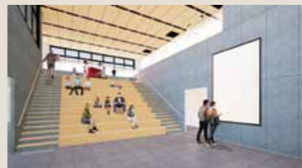
大階段「メディアコモンズ」 (イメージ)

建物の中央には、シンボルとなる大階段を設置します。階段としての機能だけでなく、腰をかけて、作品を鑑賞できる機能を有した「メディアコモンズ」と呼びます。イベント時には、観客席としても活用されるなど、開放的で多様な過ごし方が生まれる滞在スペースです。