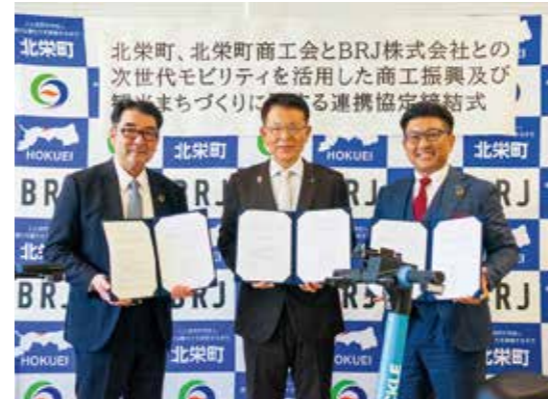
導入予定モビリティと3者の記念撮影

3月26日、北栄町、北栄町商工会、BRJ株式会社（東京都）の三者は次世代モビリティ（電動シートボードなど）を活用したまちづくりに関する協定を結びました。 この取り組みは、新しい移動手段を導入することで、観光客や住民の皆さんがよりスムーズに町を移動できるようにし、地域を元気にすることを目的としています。 今年の秋には、由良宿地区で「実証実験」を行う予定です。この乗り物は16歳以上であれば免許がなくても運転でき、自動で停止する安全機能も備わっています。最新のテクノロジーを活用し、誰もが楽しく安全に移動できる魅力的なまちづくりを進めていきます。