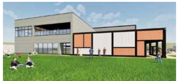
建物裏の芝生広場 (イメージ)