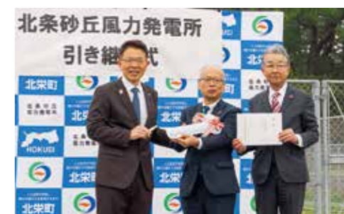
新会社へ、目録と風力発電所の鍵が手渡される

今後、作られた電気は「株式会社鳥取みらい電力」へ販売され、町内の公共施設、事業所、家庭などに活用されます。