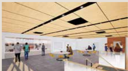
休憩スペース (イメージ)

令和9年春のオープンに向けて、一歩ずつ準備を進めています。新しく生まれるこの場所で北栄町ならではの風景と時間を、どうぞ楽しみにお待ちください。