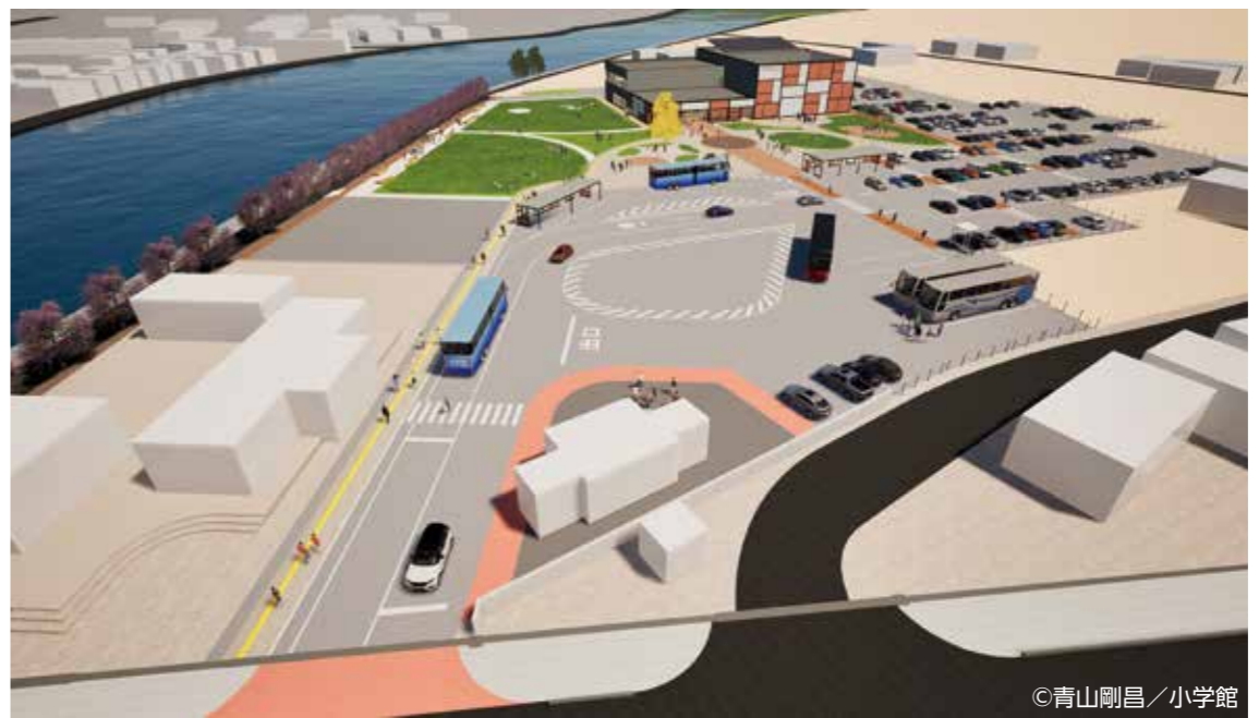
敷地全体 (イメージ)