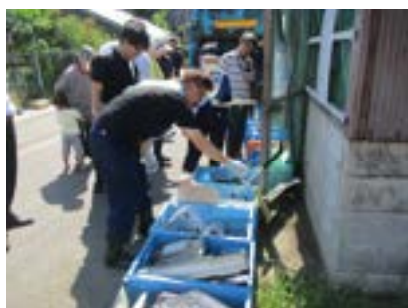
（令和6年度環境パトロール）