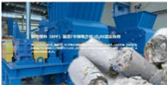
(RPF：三光株式会社HPより)