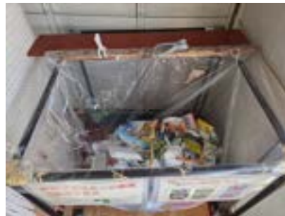
(リサイクルステーションでの回収状況)