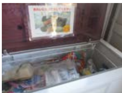
（軟質プラスチック集積状況）