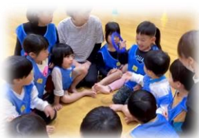
クラス対抗でリレーをしたよ。「どうやったら勝てるかな?」「ピーマン食べたら速くなる!」「バトン渡しの練習してみよう!」