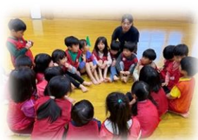
「次もアンカーがやりたい!」「いいよ!」走る順番を相談して決めていきます。