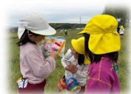
たくさん自然に触れて遊ぶよ。友達がいるからもっと遊びが面白くなるよ。うれしいね!