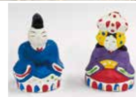
加藤廉兵衛「土人形」