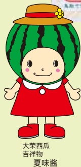
大荣西瓜 吉祥物 夏味酱