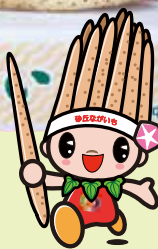
沙丘长山药 吉祥物 沙丘Tororon