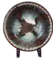
生田和孝《饴轴钵大钵》