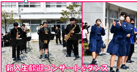
新入生歓迎コンサート&ダンス