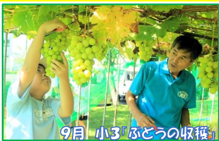
9月 小3「ぶどうの収穫」

【学校支援の充実】大人の専門性や地域の力を生かした教育活動の実現⇒学校教育の充実