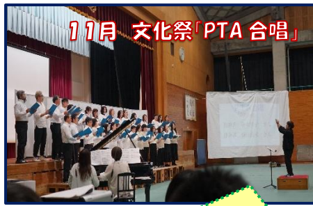
11月 文化祭「PTA 合唱」