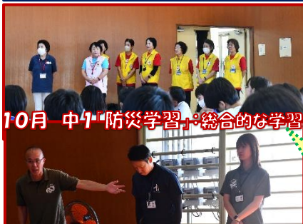
10月 中1「防災学習」:総合的な学習