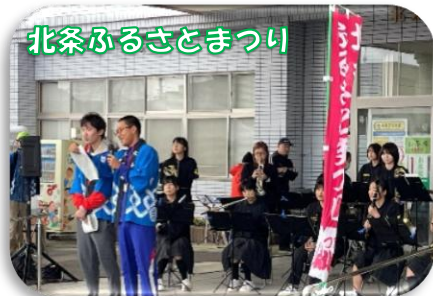
北条ふるさとまつり

今年も、ワクワク北条(7月)の取り組みで、中学校2年生が地域の事業所の皆さんに大変お世話になりました。24の事業所が受け入れてくださり、生徒の夢や将来の道筋につながる貴重な体験を支えてくださいました。「北条の子が地域で育つ仕組み」に感謝です!!