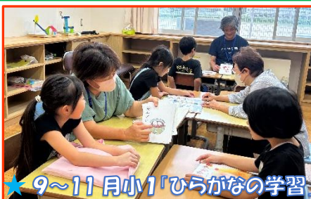
★ 9~11月小1「ひらがなの学習」