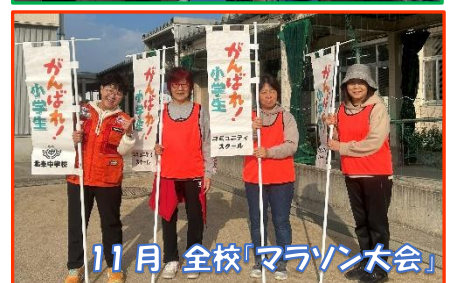
11月 全校「マラソン大会」