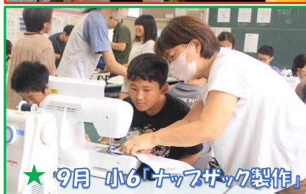
★ 9月 小6「ナップザック製作」