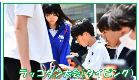
ラッコダンス大会(タイピング)

CS活動に、ご理解・ご協力いただきありがとうございます。 令和7年度は、地域の方と繋がれる場を今以上に広げたいと願っています。「地域で楽しいことするよ！子どもたち集まれ!!」「地域の活動をぜひ手伝ってほしい！」など、お誘いいただけるとありがたいです。小中学生が地域の中で活躍する姿をお知らせください。