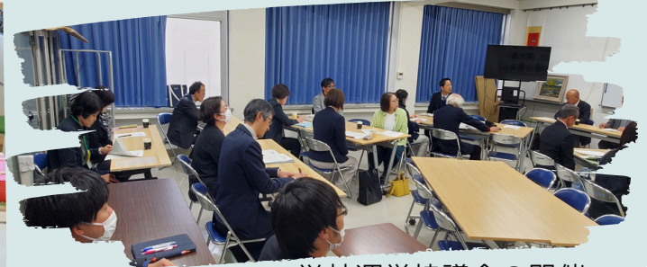
学校運営協議会の開催